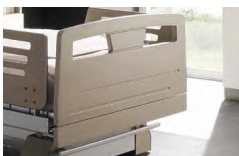
Panel Typ II

Prosta elegancja, boki i góra wzmocnione listwą z drewna bukowego