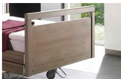
Panel Typ I

Jeszcze więcej indywidualności i wolności w wyborze. Estetyka i technologia na równie wysokim poziomie. Różnorodność umożliwiającą wybór zgodny z indywidualnym gustem.