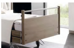
Panel Typ IV

Naturalne piękno litego drewna bukowego z wyszukany designem. Dostępny tylko z dzielonymi barierkami