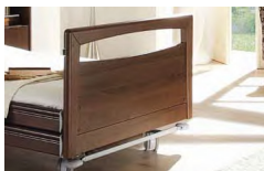
Panel Typ VII

Nowoczesny design zaakcentowany wyborem materiałów. Prosty panel z uchwytem ze stali malowanej proszkowo