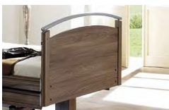
Panel Typ V

Nowoczesny design wynikający z doboru materiałów. Prosty panel z uchwytem ze stali malowanej proszkowo